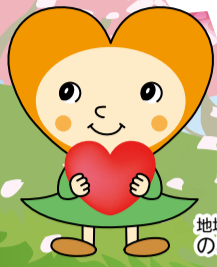
地域福祉推進のマスコットの みんちゃん