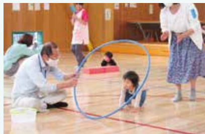
親子サロン「ミニ運動会」でのふれあいの様子

そして主任児童委員のメンバーは、各地域の児童委員の方と連携・協力しながら取り組んでいます。子どものことで何か困りごと等がありましたら、遠慮なく私たち主任児童委員に声をかけてください。