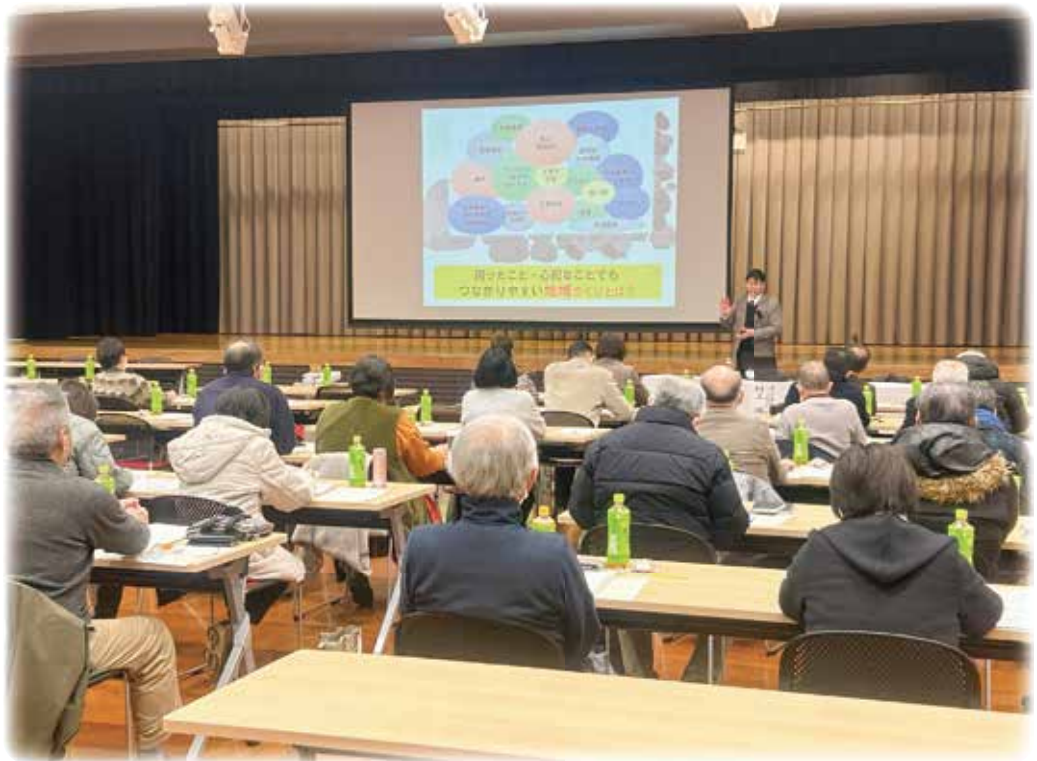
能美市民生委員児童委員協議会新年研修会 (R6.1.12) の様子

令和 6 年能登半島地震で被災された皆さまに、 心よりご冥福とお見舞いを申し上げます