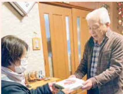
社協が行うふれあい弁当で、声かけ・安否確認!