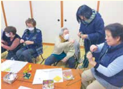
いきいきサロンでも笑顔や声かけを大切にしています

今年もまた訪問が始まります。これからも笑顔と柔らかい声かけを忘れず、皆さんとのつながりを深めていきたいと思えます。