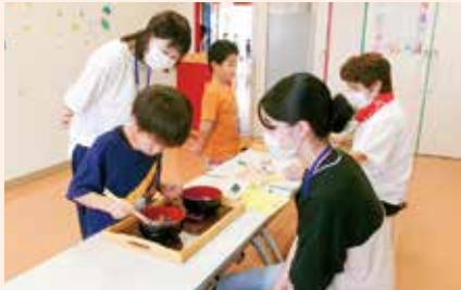
児童館行事に参加し、子どもたちとのふれあいを大切にしています

いつも地域の方からの「たすかった」「ありがとう」そんな言葉が私たちの支えになっています。自分一人では何もできないけれど、専門機関と連携しながらできる範囲のことを周囲の人々と一緒になって行動することで、いろいろなつながりができ、可能性の広がりを感じています。これからも、あなたのまちの民生委員・児童委員として、活動していきたいと思えます。お気軽に声かけください😊。