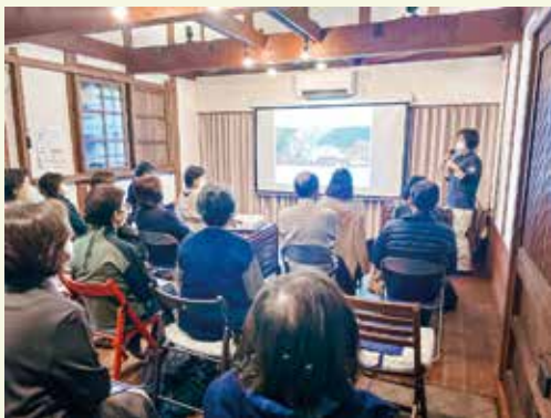
富山県砺波市である「ものがたり診療所」に視察研修に行き、学びを深めました

今も迷いながらの日々ですが、焦らずできることから少しずつやればいかなと思っています。そして地域の皆様と共にひとつでも嬉しい事に出会えたらいいなと思います。