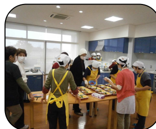
盛り付けや掛け紙を見ていただきました