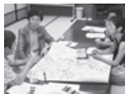
住民流支えあいマップの前に、課題を話し合う