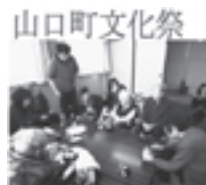
町の文化祭に町内の福祉施設からも出展

町民同士のふれあいの機会を増やすため、旧公民館の活用を検討したり、地域福祉活動への協力者の拡大のためのPRにも取り組んでいます。