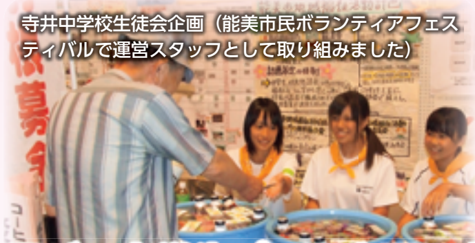
寺井中学校生徒会企画（能美市民ボランティアフェスティバルで運営スタッフとして取り組みました）