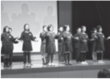
“友だちになるために”を手話で発表する粟生小学校手話サークルのみなさん

最後には、参加者全員が輪になり、心を一つにして、世界に一つだけの花を歌い、会場はあたたかい雰囲気になりました。