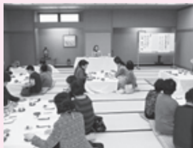
介護に役立つ話に聴き入る参加者