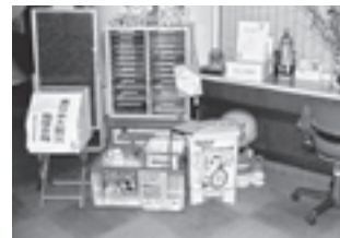
本所(辰口健康福祉センター)