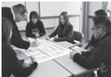
地域の為に何をしなくてはいけないのか!!

市民から信頼される職員を目指し、明るく誠実に、地域福祉の推進に頑張りたいと話していました。