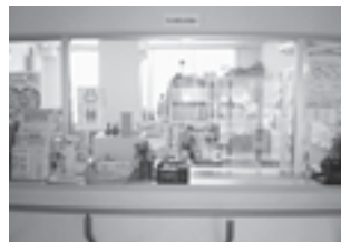
寺井支所(ふれあいプラザ)