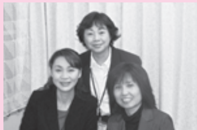
(寺西・田浦・中山)

能美ねあがり居宅介護支援事業所は、3人のケアマネジャーが常駐して、日々、ご利用者の方々のために東奔西走しています。