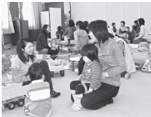
市内3ヶ所で開催しています