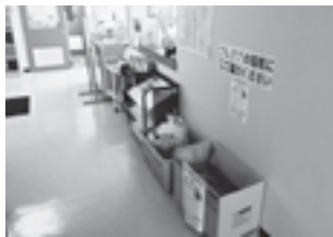
根上支所(旧西任田保育園)

市内全保育園の皆さん 福岡小学校 和気小学校 宮竹小学校 辰口中学校 はまなす作業所 グラウンドゴルフ愛好会きらら会 東レ株式会社石川工場 (順不同・敬称略)