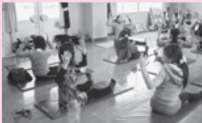
ピラティスで心も身体もリフレッシュ！