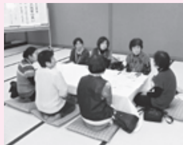
介護者同士の話し合いの様子