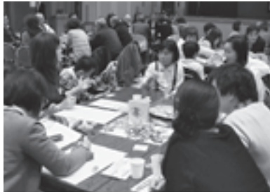
自分の住む地域について一緒に考え、話し合った！

※ふれあい福祉ウィークは、昨年度に引き続き、市民の障がいへの理解を深めていただく機会として、又、障がいを持つ方が社会のあらゆる分野に積極的に参加する意欲を高めることが目的で開催されました。